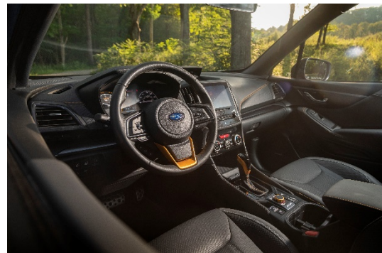
フォレスター ウィルダネス(米国仕様車)

「フォレスター ウィルダネス」は、2021年3月に発表した「アウトバック ウィルダネス」(北米専用車)に続く、ウィルダネスシリーズ第二弾となるモデルです。安心感や走りの愉しさといった、「フォレスター」が従来から提供し続ける価値はそのままに、タフでラギッドなキャラクターに磨きかけたデザインと、走破性や機能性の強化により、個性をさらに際立たせました。