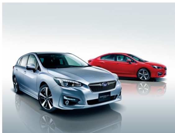
新型インプレッサ(2016年秋に発売予定)