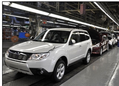
群馬製作所矢島工場 生産ライン(2010年)