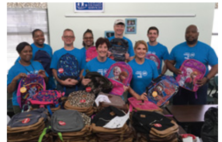
2,000個以上のバックパックに本や教材を詰める作業を行った従業員たち

2015年8月、SOA本社・各事業所の従業員および販売会社が協力し、全米各地の学校200校以上に1万6,000冊以上の本や教材を寄贈しました。