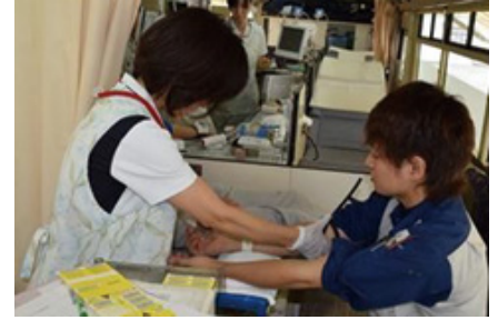
宇都宮製作所での献血の様子

献血を通して一人でも多くの方のお役に立てるよう、これからも献血活動に協力していきます。