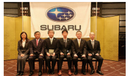
表彰を受けた従業員2名（左から3・4番目）と当社役員

これを具現化する取り組みとして、積極的なボランティア活動を通じて地域や社会に貢献している従業員を表彰しています。この表彰制度は2006年に創設し、2016年6月の第11回表彰式では2名の従業員を表彰しました。