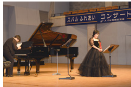
ふれあいコンサート

スバル地域交流会で実施している「ふれあいコンサート」では、不要なタオル、石鹸、日用品などをお客さまにご持参いただき、それらを福祉協議会へ寄付する活動を行っています。