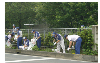
左：宇都宮製作所「クリーンキャンペーン」