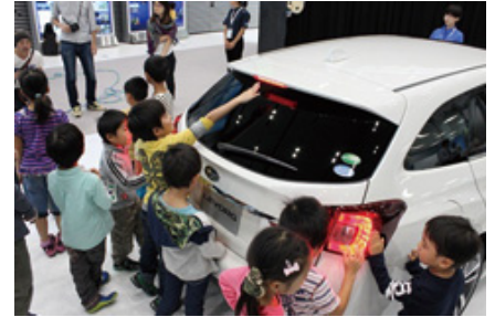
交通安全教室の様子

2015年10月、本社ショールーム「スタースクエア」で「スバルの交通安全教室」を開催しました。このイベントは、小学校低学年の児童を対象に、交通安全への意識を深めてもらうことを目的としたものです。当日は、安全のためのポイントを楽しく学べるよう、映像紙芝居と4つの体験型プログラムを行いました。