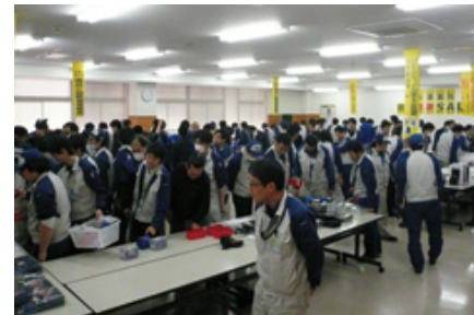
チャリティバザーの様子

本社ショールーム「スタースクエア」で行われたスバルモータースポーツオークション、群馬製作所で行われたスバル感謝祭、東京事業所で行われたチャリティバザーの収益金を、2015年9月に公益財団法人 交通遺児育英会、2016年3月に公益財団法人交通遺児等育成基金に寄付しました。寄付金は、交通遺児の健全な育成・就学支援などのために活用されています。