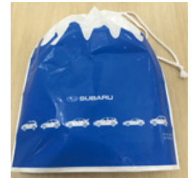
配布したオリジナルゴミ袋