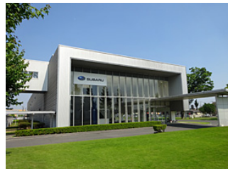
スバルビジターセンター

http://www.subaru.co.jp/about/showroom/vc/