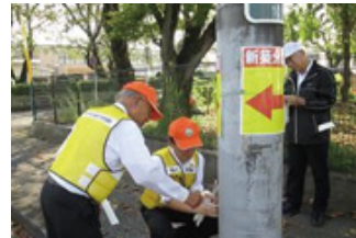
左：宇都宮市内の夜間における交通事故防止用の反射材を電柱に貼付する活動

各事業所では、警察や安全運転管理者協会などの協力のもと、事業所周辺の通学路の街頭交通指導や夜間における交通事故防止用の反射材を電柱に貼付する活動などを行い、交通安全・事故防止のための活動を推進しています。