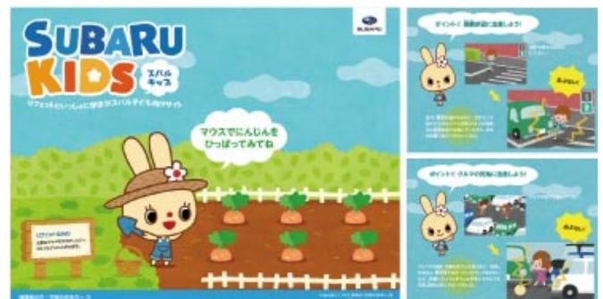
子ども向けサイト「スバルキッズ」

また各事業所では、従業員に対しても長期連休前をはじめ、折に触れて交通事故防止の啓発を行うなど、交通社会の一員としての意識づけを積極的に行っています。