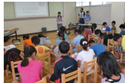
宇都宮市内の小学校での環境授業

活動を始めた2006年から宇都宮・半田地区累計172校（12,003名）となっており、地域に定着した活動となっています。