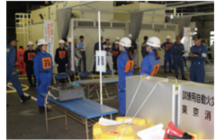
自衛消防訓練審査会の様子

東京事業所ではこの審査会に毎年参加することで、訓練経験者を養成し、万が一の災害発生時の迅速な対応を目指しています。