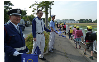
右：埼玉製作所の通学路での交通安全指導